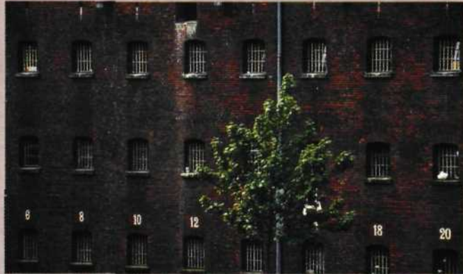
Untersuchungsgefängnis Münster: Unter falschem Verdacht