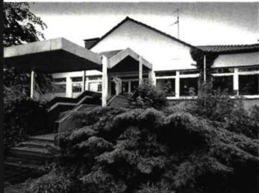
Montessori-Kindergarten in Coesfeld Die Vorverurteilung war flächendeckend

Friedrichsen und Mauz begründeten vielmehr detailliert, warum es sich beim Fall „Montessori“ um eine wahnhaftige Massenbeschuldigung handelte, die jeglicher realen Grundlage entbehrte. Sie zogen Parallelen zu den Fällen amerikanischer „Hexenjagden in Kindergärten“, die jetzt, mit zehnjähriger Verzögerung, auch in Deutschland ausgebrochen wären. Diese Analyse machte Sinn, erklärte mir die vielen Ungereimtheiten, die ich bis dahin nicht verstanden hatte. Sie öffnete mir den Blick für eine